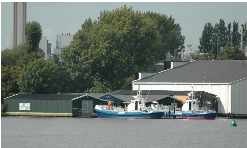
De ligplaats van de boten bij de WRDZ

Er zijn geen voorzieningen – als walstroom – aanwezig.