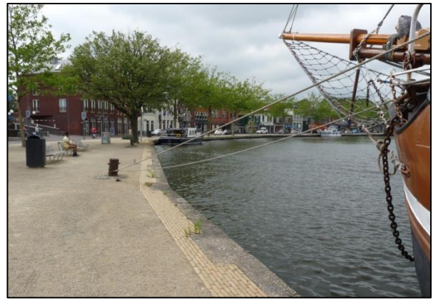
De kade gezien in Westelijke richting