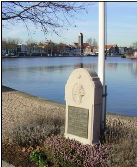
2. Monument voor gefusilleerden

De 'Javazee' en 'De Zeemanspot' eventueel in de laag (naast elkaar).