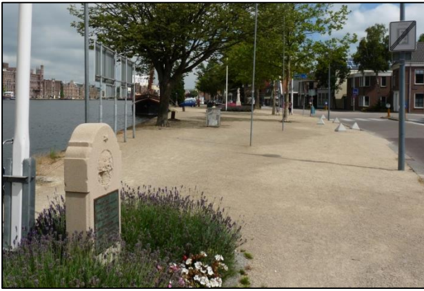
De kade gezien in Oostelijke richting.