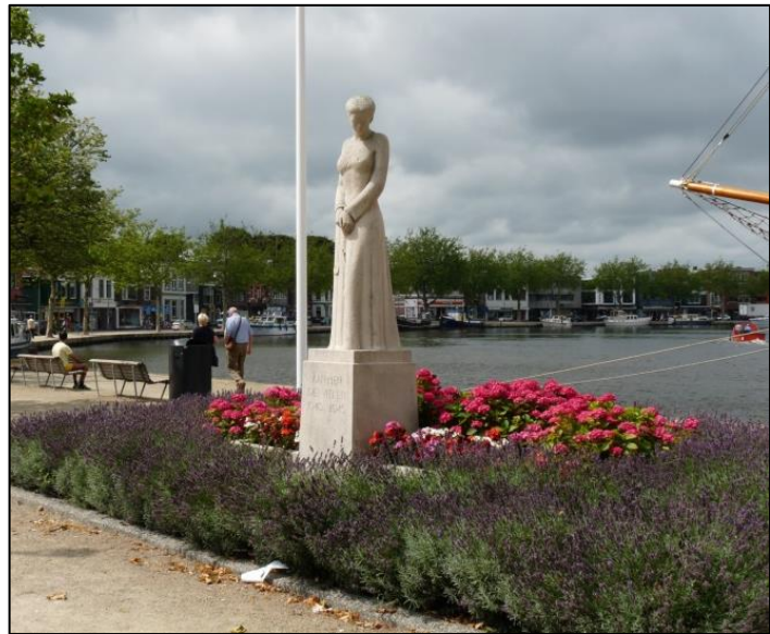
1. Monument voor de gevallen '40-'45